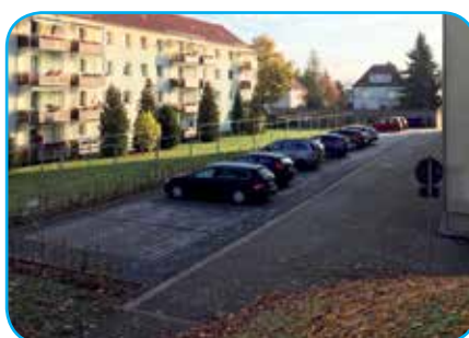
... und nach Fertigstellung