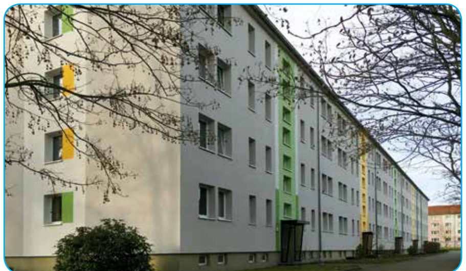
„Straße der Jugend 23–27“

Im kommenden Jahr werden am Wohngebäude „Neschwitzweg 1–31“ umfangreiche Sanierungsarbeiten ausgeführt und in diesem Zusammenhang auch die Außenanlagen neu gestaltet. Die Vorplanungen dazu sind abgeschlossen, so dass die betreffenden Mitglieder und Mieter hierüber in Kürze informiert werden. Und selbstverständlich berichten wir dazu auch in der nächsten Mieterzeitschrift.