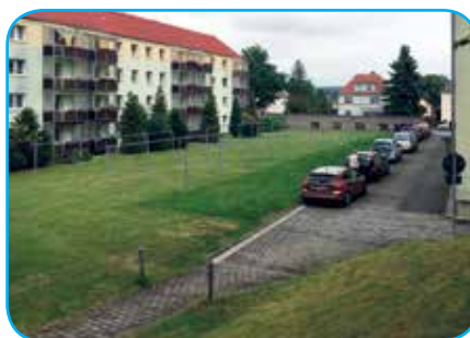
„Am Wolfsgraben 22–26“ vor ...

Im Rahmen der Tiefbauarbeiten waren unvorhergesehene Untersuchungen des Baugrundes im Bereich der „Straße des Aufbaus“ notwendig. In deren Ergebnis stellte sich heraus, dass eine ausreichende Tragfähigkeit nur mit zusätzlichen Stabilisierungen gewährleistet werden kann. Entsprechende Maßnahmen setzte die ausführende Fachfirma um, wodurch sich der ursprünglich geplante Fertigstellungstermin ein wenig nach hinten verschob. Dennoch konnten die ersten 37 neu geschaffenen Pkw-Stellplätze bereits Anfang August zur Nutzung durch unsere Mitglieder freigegeben werden.