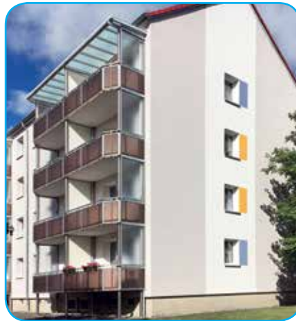
„Straße der Jugend 19–22a“

Gemäß des langfristigen Unternehmenskonzeptes erfolgte hier ein Überholungsanstrich an den Fassaden der Gebäude „Straße der Jugend 19–22a“ und „Straße der Jugend 23–27“. Die Fassadengestaltung wurde nach einem abgestimmten Farbkonzept vorgenommen und trägt künftig verbindenden Charakter zwischen den genossenschaftlichen Wohngebäuden in der „Straße der Jugend“. Darüber hinaus wurden weitere Kleinreparaturen z. B. an den Dachrinnen durchgeführt und die Eingangspodeste mit einer neuen Beschichtung versehen. Im kommenden Frühjahr werden diese Arbeiten am Gebäude „Straße der Jugend 13–18“ fortgeführt. Baubeginn soll im April 2017 sein.