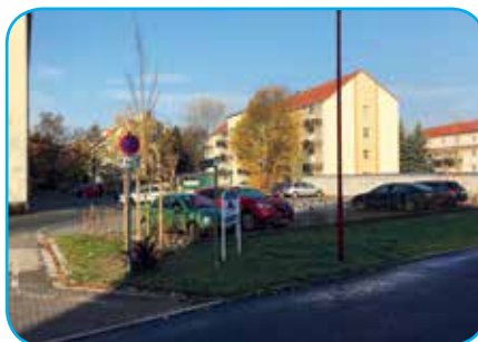
... und nach Fertigstellung

Im Anschluss erfolgten Tiefbauarbeiten in vergleichbarer Art und Weise vor der „August-Bebel-Straße 70–76“. Hier entstanden insgesamt 20 neue Pkw-Stellplätze, von denen zwei als Behindertenstellplätze ausgeführt wurden. Die