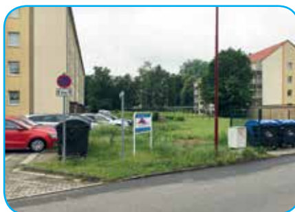
„Straße des Aufbaus 8–16“ vor ...