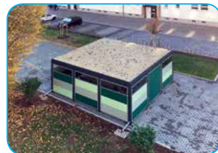
Fahrradhaus „Straße des Aufbaus“

Die Ausführung der Fahrradhäuser erfolgte in zwei verschiedenen Varianten. In der „Straße des Aufbaus 8–16“ wurden so insgesamt 24 Einstellplätze und am Objekt „August-Bebel-Str. 70–76“ weitere 16 Einstellplätze geschaffen. Von unseren Mietern sind diese bislang gut angenommen worden. Die Fahrradständer sind bewusst mit komfortablem Anlehnbügel ausgestattet, um ein sicheres Anschließen der Fahrräder zu ermöglichen. Beide Fahrradhäuser erhielten eine extensive Dachbegrünung und tragen somit zur gelungenen Neugestaltung der Außenanlagen bei.