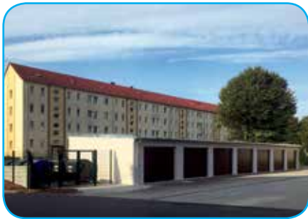
Garagen und Müllplatz „August Bebel Straße 70–76“

ableitungen und der Dachrandverblendung erneuert sowie der vorhandene Fassadenputz ausgebessert und mit einem frischen Farbanstrich versehen. Des Weiteren umfassten die Arbeiten den Einbau neuer Metall-Schwingtüre sowie die Ausstattung aller Garagen mit Licht und Steckdosen. Die Auflösung des bisherigen zentralen Müllplatzes sowie der Bau mehrerer kleinerer und vor allem abschließbarer Containerplätze entlang der „Straße des Aufbaus“ rundeten die Maßnahme entsprechend ab.